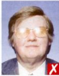
Отражение вспышки на линзах