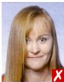
Волосы поперек глаз