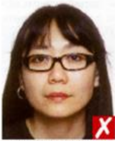
Оправа слишком толстая