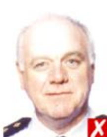
Отражение вспышки на коже