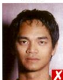
Тени позади головы