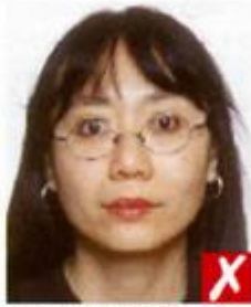
Оправа закрывает глаза