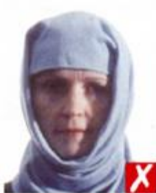
Тень поперек лица