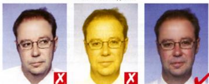
Смотрит в сторону