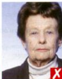
Не по центру