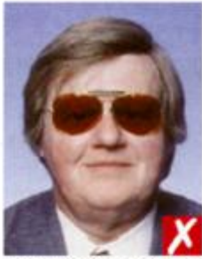
Темные окрашенные линзы