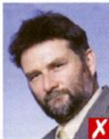
Глаза под наклоном