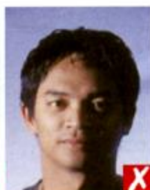
Тени поперек лица